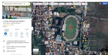
Gambar 1 . Lokasi Stadion letjen H. Sudirman Kabupaten Bojonegoro

Objek penelitian berada di stadion Letjen H. Sudirman Bojonegoro (Jl. Lettu Suwolo, Mlaten, Ngroworejo, Kec. Bojonegoro, Kabupaten Bojonegoro, Jawa Timur 62119) dengan koordinat 7°08'53.0"S 111°54'02.0"E