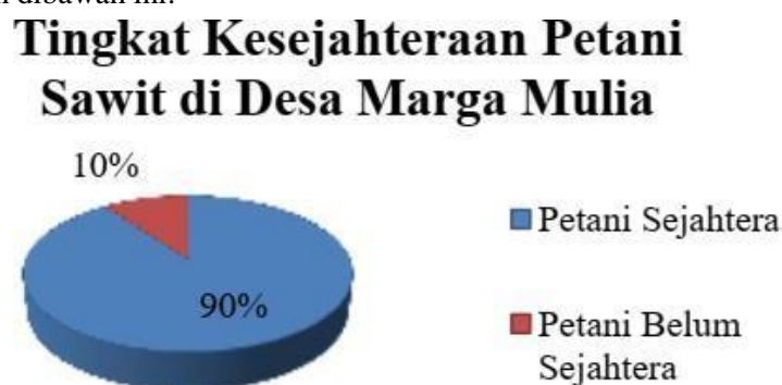
Gambar 1. Diagram Tingkat Kesejahteraan

Untuk melihat tingkat kesejahteraan petani sawit di Desa Marga Mulia Kecamatan Kikim Timur Kabupaten Lahat dapat dilihat dari Diagram dibawah ini: