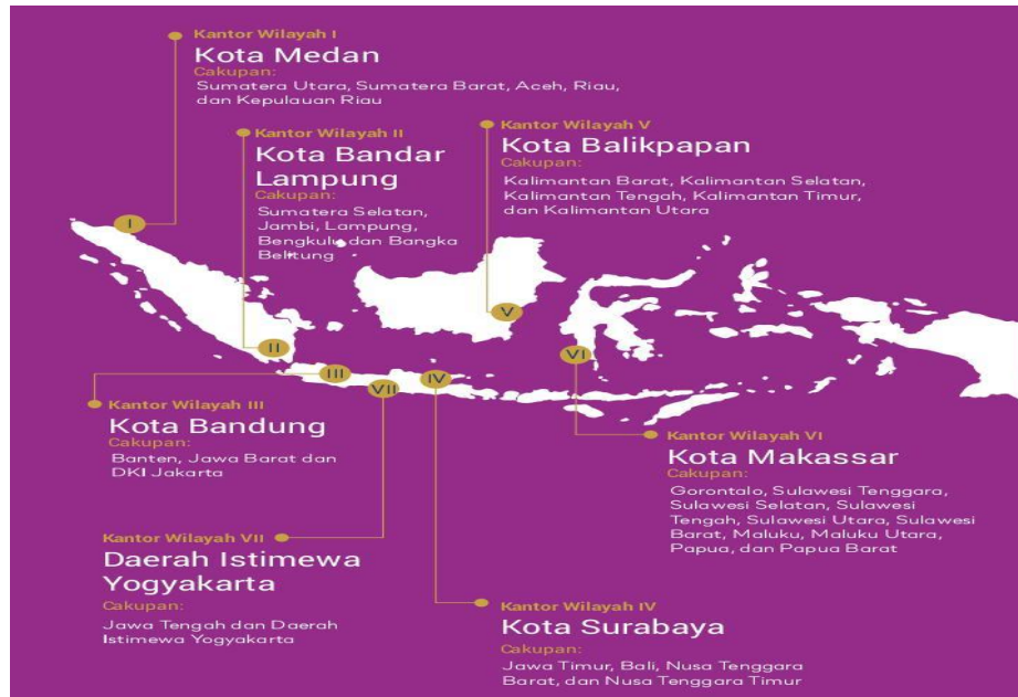
Gambar 1.3 Persebaran Kantor Wilayah KPPU