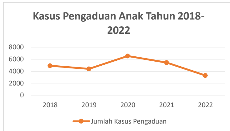
Grafik 1. Tren Kasus Pengaduan Anak 2018-2022

orang tua dan calon orang tua tentang cara mencegah kekerasan dalam keluarga. Grafik 1.1 berikut menunjukkan jumlah tren kasus pengaduan anak: