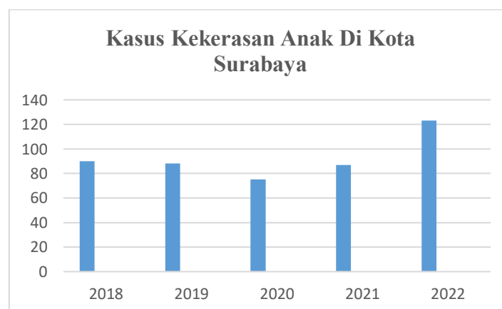
Grafik 2. Jumlah Kasus Kekerasan Anak Di Kota Surabaya antara tahun 2018-2022

Namun, informasi yang telah dikumpulkan dari DP3APPKB di Kota Surabaya menunjukkan bahwa dari tahun 2018 hingga 2022, terjadi 463 kasus kekerasan terhadap anak di Surabaya. Grafik 1.2 berikut menunjukkan jumlah kejadian kekerasan terhadap anak di bawah ini: