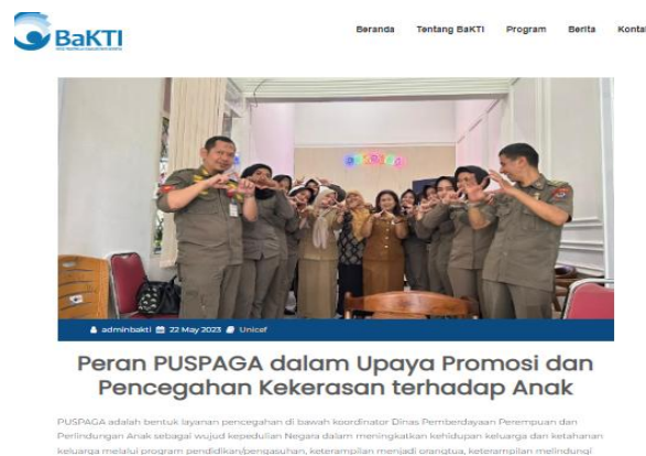
Gambar 2. Peran PUSPAGA Dalam Pencegahan Kekerasan Anak

Dikutip dari berita online pada website liputan 6.com pada gambar 1.3 diatas, bahwa banyaknya kasus kekerasan pada anak yang terjadi di kota Surabaya dari Januari hingga Agustus 2023, 122 dari 173 kasus kekerasan pada anak terjadi diantaranya terdiri dari 51 kasus kekerasan terhadap orang dewasa, 51 terdiri dari kekerasan pada anak berhadapan hukum (ABH), 26 terdiri dari kekerasan anak karena KDRT, dan 69 terdiri dari non-kekerasan KDRT. Salah satu cara untuk menghindari kekerasan adalah berkomunikasi dengan orang lain dan dengan keluarga.