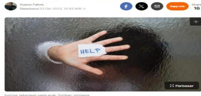
Gambar 1. Kasus Kekerasan Anak Di Kota Surabaya