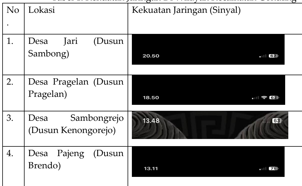
Tabel 1. Kekuatan Jaringan Di Wilayah Kecamatan Gondang