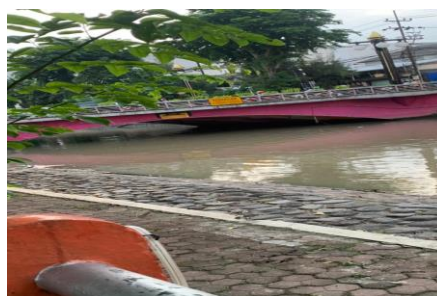
Gambar 2 Jembatan dengan ketinggian rendah

Setelah itu, dari observasi peneliti Sungai Kalimas yang memiliki Panjang Total 8km (Dinas PU Balai Besar Wilayah Sungai Berantas, 2022) disepanjang sungai kalimas dari ujung Perak (Petekan) – Kayoon (Gubeng) membentang total 9 jembatan dengan rincian 8 jembatan dengan ketinggian tinggi dari permukaan air dan 1 jembatan dengan ketinggian rendah dari permukaan air.