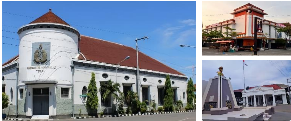
Gambar 8. Bangunan Cagar Budaya Kota Tegal

Pada Koridor Jalan Pemuda ada lebih dari satu/beberapa bangunan cagar budaya yang memiliki nilai sejarah dan memerlukan tindakan preservasi. Sesuai dengan Undang Undang Nomor 11 Tahun 2010 Tentang Cagar Budaya, terdapat beberapa bangunan yang termasuk dalam bangunan cagar budaya di Kawasan Kota Lama Tegal Barat, diantaranya Bangunan Lanal Angkatan Laut, Kantor Pos, Gedung DPRD, dan Tower PDAM (Pertiwi & Paramudhitaningtyas, 2025).