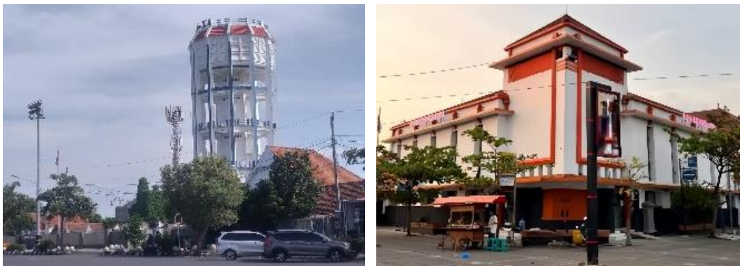
Gambar 5. Sirkulasi Lokasi Penelitian Sumber: Dokumentasi Penulis, (2025)

Sirkulasi pada koridor Jalan Pemuda dikondisi eksisting mengalami beberapa/sebagian perubahan, pada dasarnya jalur ini merupakan arus masuk dan keluar dari Jalur pantura dengan sifat dua arah. Sebagian besar terdapat parkir badan jalan ( on street parking ) pada sepanjang koridor Jalan Pemuda. Titik parkir antara kendaraan roda empat dengan kendaraan roda dua belum dipisahkan. Titik parkir tersebut antara lain di depan Lanal TNI AL, depan bangunan kantor POS, dan depan Gedung DPRD.