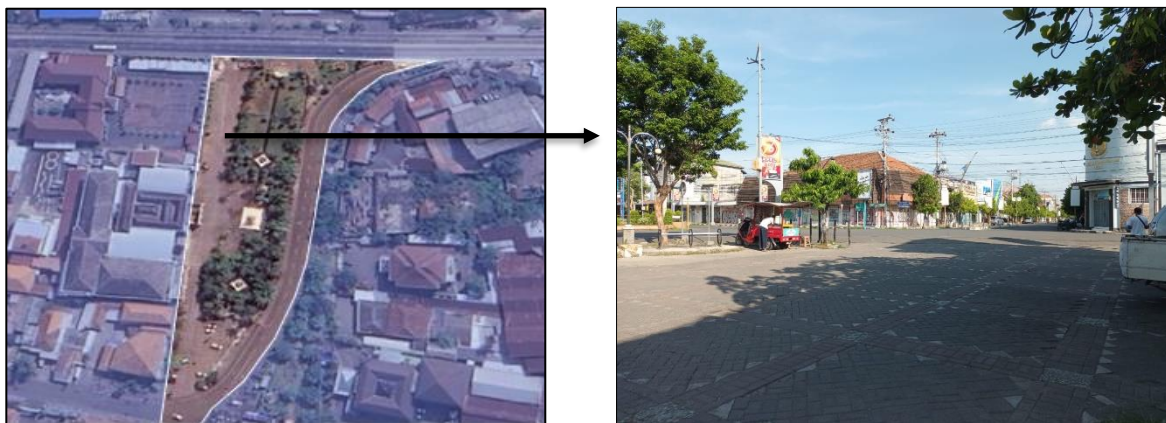
Gambar 2. Ruang Lingkup Studi

Dalam penelitian ini dipilih Jalan Pemuda sebagai lokasi penelitian, karena kawasan ini memiliki delapan elemen percangan kota sesuai teori Hamid Shirvani dan termasuk dalam Kawasan Central Bussiness District (Gambar 2).