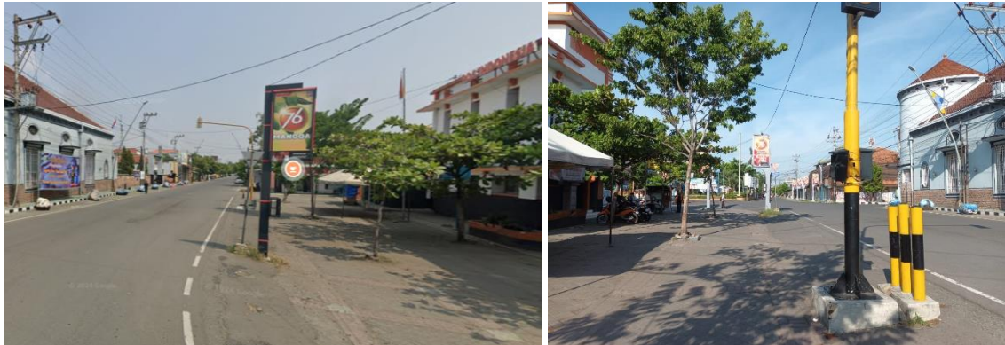
Gambar 4. Massa Bangunan

lebih lima meter yang kemudian digunakan untuk pedestrian dan taman kota dengan vegetasi yang kurang dan perkerasan material paving blok.