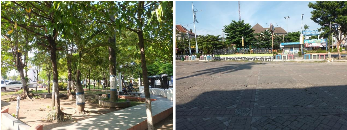
Gambar 6. Ruang Terbuka Hijau

angsur mengurangi dimensi area vegetasi sebagai pendukung keberlanjutan lingkungan kota.