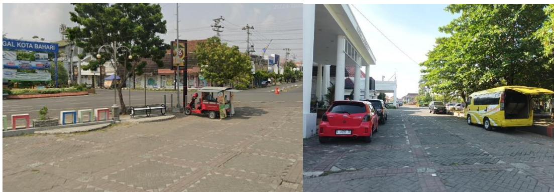
Gambar 7. Jalur Pejalan Kaki

Jalur pejalan kaki di kawasan cagar budaya Kota Tegal memiliki kondisi berbeda pada sisi kanan dan sisi kiri. Jalur pejalan kaki di Balai Kota berupa aracade yang bersatu dengan ruang terbuka publik. Jalur pejalan kaki di koridor Jalan Pemuda memiliki lebar 5m, dengan kondisi banyak digunakan pedagang kaki lima sehingga keamanan dan kenyamanan berkurang. Kenyamanan bagi pengguna jalur pejalan kaki semakin menurun karena berkurangnya dimensi area untuk pejalan kaki, hal ini berdampak pada aksesibilitas dan sirkulasi jaringan di Kawasan cagar budaya Kota Tegal. Hal yang paling krusial pada jalur pejalan kaki di kawasan ini belum mempertimbangkan kenyamanan dan keamanan untuk penyandang disabilitas.